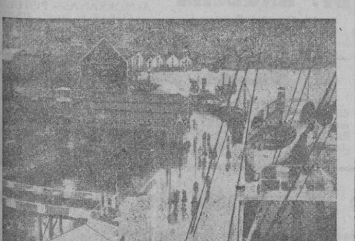
El puerto de Ramsdal por donde han reembarcado las tropas inglesas al abandonar Andalsnés

Otro acuerdo hay que por su esencial equidad merece ser traído a elogioso comentario y es el relativo a la corrección en el sistema establecido para el racionamiento del pan. Se persigue con el acuerdo que la cantidad señalada de doscientos cincuenta gramos por día y persona, no sea una cifra invariable sino un promedio que corresponda al español considerado como una unidad, para así calcular lo que hace falta suministrar e importar hasta la llegada de la próxima cosecha. Pero este promedio ha de adaptarse a las circunstancias en que se desenvuelva cada español económicamente: el que por sus bienes de fortuna pueda alimentarse con substancias de mayor valor que el pan, tendrá la obligación de reducir su consumo de aquél, en beneficio de los obreros de la ciudad y el campo que, por la cuantía de su jornal, tienen en el pan la base principal de su alimentación. Ciertamente que cuando la crisis económica derivada de la guerra, en la cual provincias enteras de las preponderantemente productoras de cereales se dejaron sembrar por los rojos, exige sacrificios, todos los españoles estamos obligados a aceptarlos; pero también es evidente que la verdadera justicia exige la proporcionalidad en el reparto del sacrificio y eso es lo que persigue la nueva disposición legal con la intervención de los Ayuntamientos y del Partido y lo que por su indiscutible equidad aceptaremos todos los españoles, como una medida más entera en el precio de la redención de España.