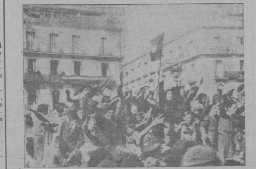
El pueblo de Madrid, ovacionó delirantemente a las tropas el día de su entrada en la capital de España