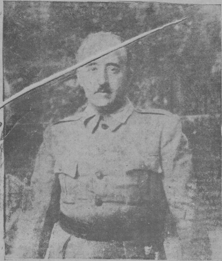
El Jefe del Estado, Generalísimo Franco, el gran artífice de la Victoria