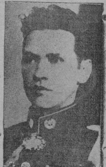
El presidente de Bolivia, Teniente Coronel D. Germán Bosch, que ha disuelto el Parlamento y ha proclamado el régimen totalitario

Luego, gimoteando mentidos cuidados humanitarios, se llevaron niños a Rusia, como semilla de futuros es-