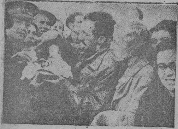
Funcionarios de Recuperación Artística, haciéndose cargo, en Carlet (Valencia), del santo Cáliz usado por Jesucristo en la última Cena. Este famoso Cáliz que se guardaba en la Catedral de Valencia, fué salvado por la señorita que aparece a la derecha, con lentes

¿Y aquella noche angustiosa, en que una Junta de Jefes con mando le designó Jefe de operaciones? No eran, aquellas circunstancias, ciertamente muy halagüeñas --ya puede decirse todo-- Dios le iluminó y a los tres días había expulsado a los rojos de Mallorca, --su más popular y glorioso triunfo-- ¿Nos habremos ya también olvidado de esto? La feliz