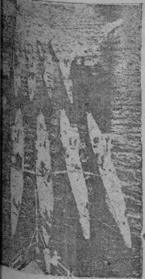
Estrella de submarinos alemanes que forma parte de la cuadrada que visita los puertos españoles

y embrutecidos por la opresión del "fascismo" no entendían de la "antifascista" y éramos tan perezosos que manteníamos en secreto el hecho de que los "leales" habían decidido para evitar que la población se entregase en masa. Eso, en "Porto Rojo" los "valientes" milicianos se dejaban aplastar por los tanques alemanes (!!), antes de proceder un paso.