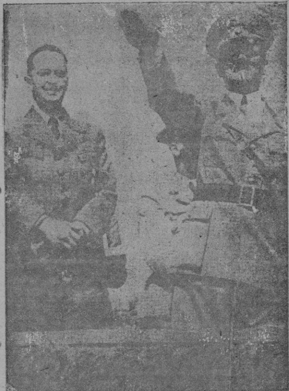
Hitler saluda al pueblo de Praga, con Konrad Henlein, a quien nombró Comisario del gran Reich en el protectorado sobre Bohemia y Moravia