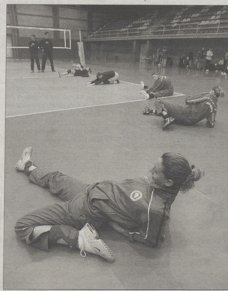
Jugadoras del Panathinaikos entrenando ayer en San Antonio.