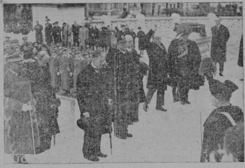
CHAMBERLAIN Y HALIFAX ANTE LA TUMBA DEL SOLDADO DESCONOCIDO

a la Estación, de donde partirá en tren especial directo a Inglaterra, sin detenerse en París. Chamberlain llegará a Londres el domingo a las 5'30 de la tarde.