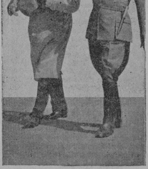
EL FUHRER Y EL DUCE. LOS DOS HOMBRES REPRESENTATIVOS DE DOS GRANDES PUEBLOS, CUYOS DISCURSOS DE ESTOS DIAS HAN CONMOVIDO AL MUNDO

Vino un momento en que era absolutamente precisa una solución, porque amenazaba acabar el conflicto en forma repetitiva. Entonces fué cuando Inglaterra y Francia se dirigieron a Checoslovaquia con la única reivindicación posible, es decir, la entrega de los territorios alemanes al Reich. Hoy no sabemos exactamente lo que Benes ha dicho durante aquellas entrevistas, pero lo cierto es que ha reafirmado el terror. Los checos asolan en estos momentos regiones enteras como si venden fuego a ciudades y pueblos y tratan de establecer el pánico en todos los distritos de población alemana.