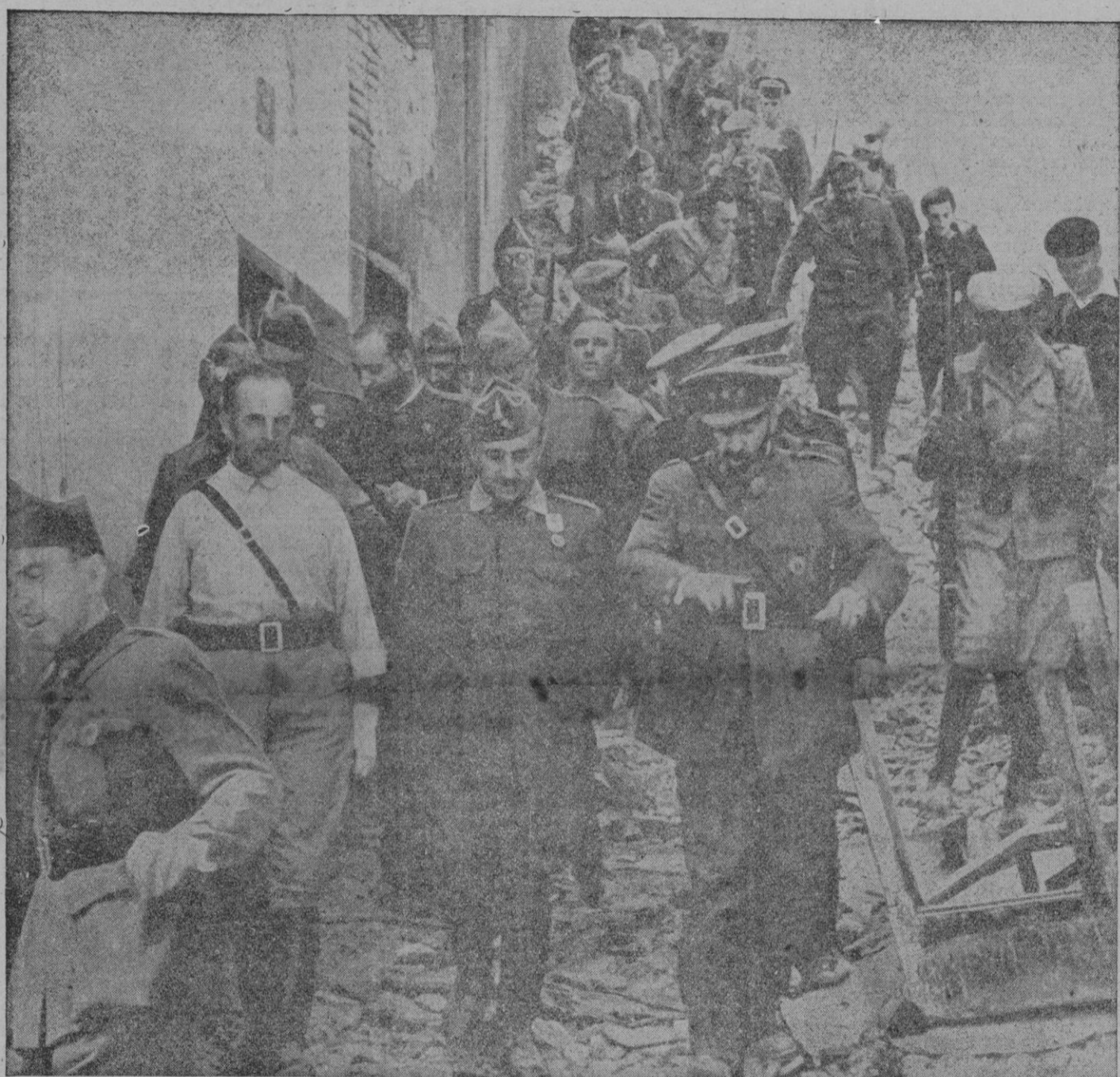
UNA FOTOGRAFIA HISTORICA: EL CAUDILLO ENTRA EN EL ALCAZAR AL SER ESTE LIBERADO