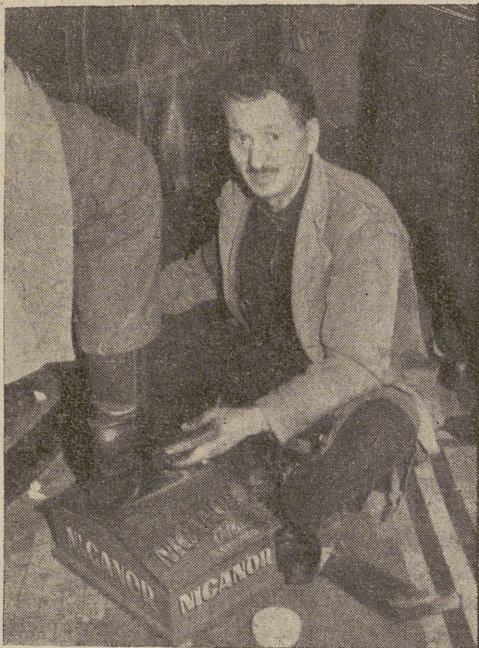
En pleno trabajo. «El Traga» demuestra su habilidad y conocimiento del oficio que realiza, como puede apreciarse en la foto, «mirando al público».

«El Tragayesos» alude luego a sus tiempos de arreador de ganado; a los de torero, bastante miedoso, por