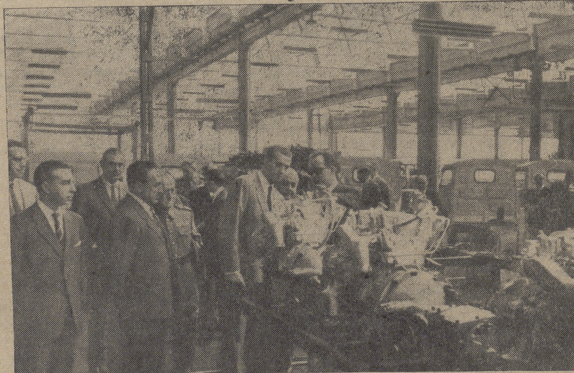
He aquí un testimonio gráfico de la visita que a la Fábrica de automóviles «FADISA» hizo el Príncipe Don Juan Carlos de Borbón, donde fue recibido por el Presidente del Consejo de Administración, Consejeros y alto personal