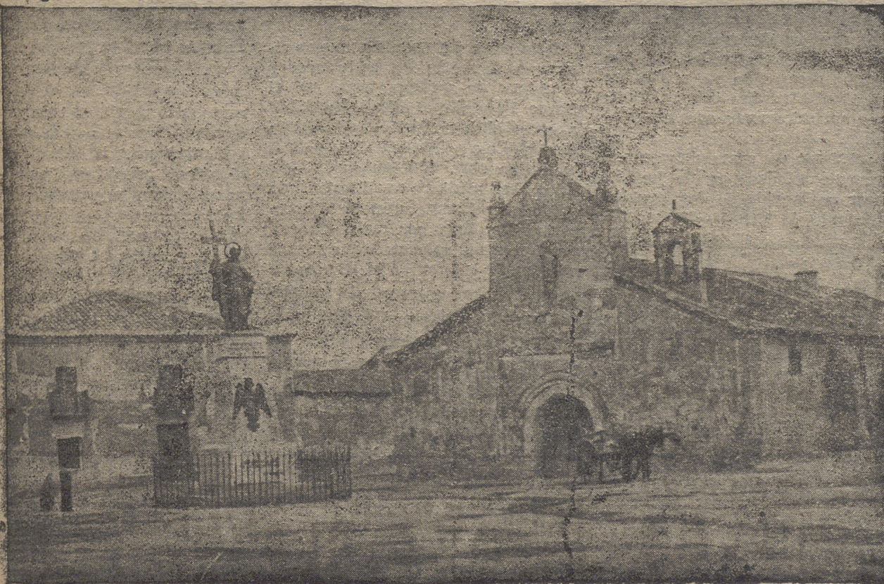
San Juan de la Cruz nació en Fontiveros, de la Tierra de Avila y nos muestra la plaza de la ilustre villa, con el monumento erigido en ella en el año 1926, centenario de la canonización y año de la proclamación de su doctorado, San Juan de la Cruz, DOCTOR EXTÁTICO.