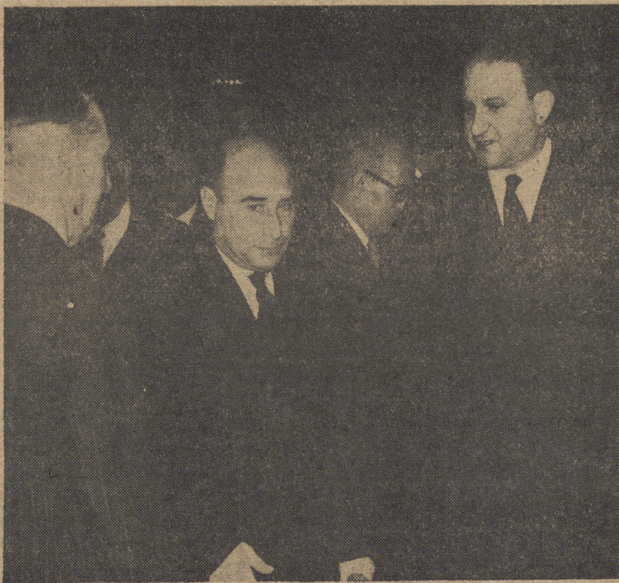
El ministro de Asuntos Exteriores de Portugal, señor Marcello Mathias, se encuentra en Madrid en visita oficial. Ha celebrado conversaciones con el señor Castiella y le han sido rendidos varios agasajos, siendo recibido por el Caudillo.