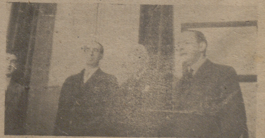
El director de la Compañía y dos funcionarios que han sido agraciados con una gran participación de «Et Gordo». (S. O. F.)

A los efectos del Subsidio Familiar no se anticipará la nómina del mes en curso, sin la previa cancelación de la que correspondía al mes precedente. Presentarla tan pronto efectúe el pago del Subsidio Familiar.