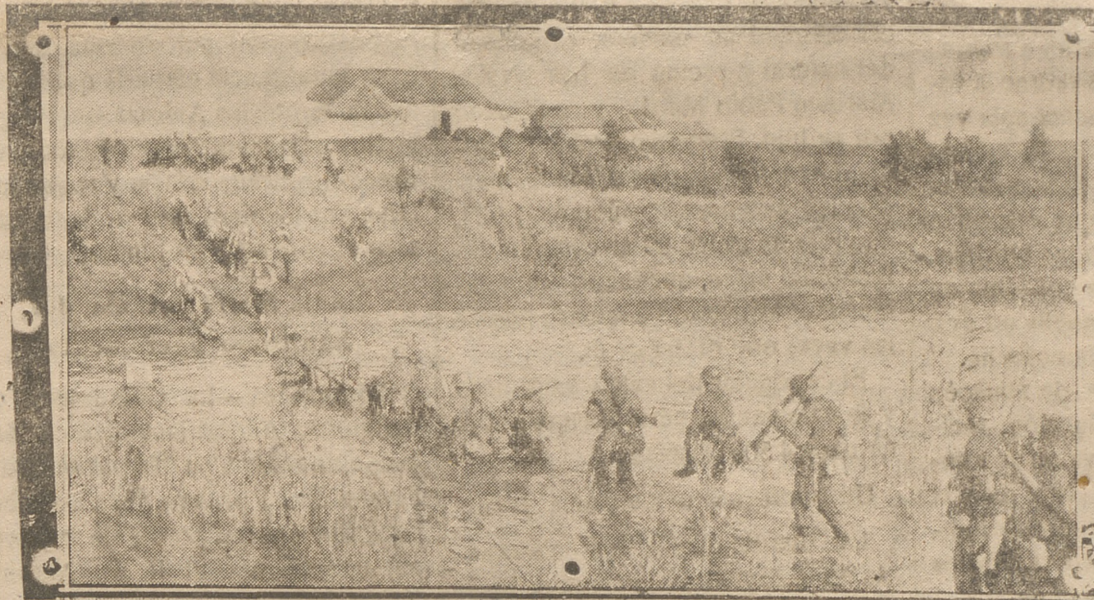
LA SITUACION INTERNACIONAL

MIRANDO A EGIPTO.—Husmeando noticias de Roma, nos encontramos con una información según la cual en las tierras del continente negro hay signos de ofensiva inminente. El comunicado número 812 registra movimiento de exploración, choques de patrullas y escaramuzas que indican ya un dinamismo que, hasta ahora, había tenido carácter interno, pues consistía