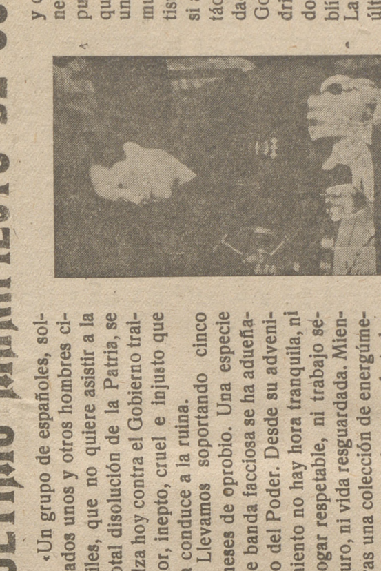
José Antonio hablando en un mitin.

«Ojalá fuera la mía la última sangre española que se vertiera en discordias civiles» (Del testamento de José Antonio). Según la filosofía, todo ser que quiera subsistir ha de conservar su unidad. Jesucristo, el fundador del gran Reino de las Almas, fundó contra el engrandecimiento pagano y el bienestar y la pacificación de los espíritus, bien es el bautismo y una es la cabeza y una es la fe, uno es el espíritu, una es la fe, uno es la unidad hacia Jesús, en los momentos sublimes de su tránsito al Padre; que sean una misma cosa, como Tú y yo somos una misma cosa. José Antonio, cabeza de pensador con magnífica intuición, corazon cristiano con sentimientos de padre, vió claramente la necesidad de esta unidad. Por eso él proclamó como un principio de disgregación, y es la antitesis