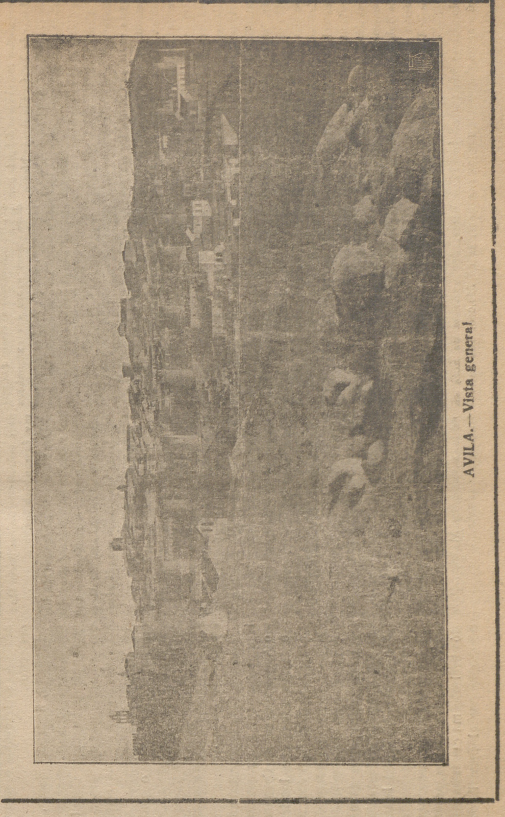
AVILA. -- Vista general