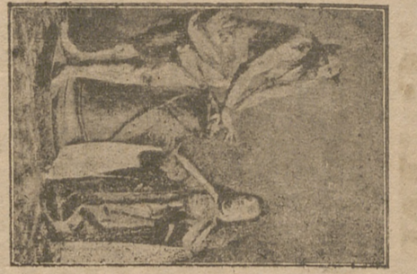
CRISTO ATADO A LA COLUMNA según el grupo escultórico de Gregorio Hernandez