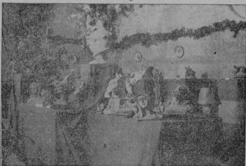
Un detalle de la Sección de Modelado de la Exposición inaugurada en la Academia Provincial de Bellas Artes.