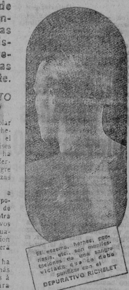
El examen, herpes, positisia, etc., son manifestaciones de una sangre viciada que se debe purificar con el DEPURATIVO RICHELET

Ocasión YOST-MONARCH (carro grande) UNDERWOOD ROYAL, garantizadas. Casa Malandra, Jaime I, 78.