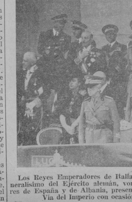
Los Reyes Emperadores de Italia, a quien acompañaban el Duce, el Generalísimo del Ejército alemán, von Brauchitsch, y las misiones militares de España y de Albania, presenciando el gran desfile celebrado en la Via del Imperio con ocasión del Día del Ejército

Arthur Henderson, laborista, preguntó si la declaración preveía el permitir la entrada en el Mar Negro de las tropas británicas para poder socorrer a Rumanía, si fuere necesario. Chamberlain respondió evasivamente, precisando solamente que hasta este momento no se había llegado a una definición precisa.