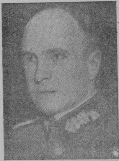
El general von Brauchitsch, Jefe de las Fuerzas del Reich

A continuación el General alemán se dirigió al Palacio del Quirinal, donde fué recibido, en audiencia particular, por el Rey Emperador y presentó luego a éste los jefes y oficiales de su séquito.