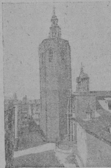
Valencia. — El Miguelete, elegante torre-campanario, de forma octogonal, de la Catedral

pañola Tradicionalista y de las JONS, pedía al pueblo que, llevado de su entusiasmo, no perdiera la serenidad, pues era inminente la llegada de los soldados nacionales; y Guadalajara y Játiva, en un verdadero delirio, saludaban a los hermanos del resto de España; y Baza, donde las gentes sacaron sus trajes domingueros, anunciaba para hoy la celebración de una solemnisima Misa de campaña; y Cartagena, donde también hoy debía haber misa, contaba como, a primera hora de la tarde, entraron en la ciudad unos camiones con falangistas y guardias de asalto, que se apoderaron de la ciudad, ya en poder de los mandos militares; y Valencia, intervenida por la tercera Compañía de Radiodifusión y Propaganda en los frentes, transmitía, a las doce y media de la mañana, malamente tocado al piano, el Himno Nacional y el "Cara al