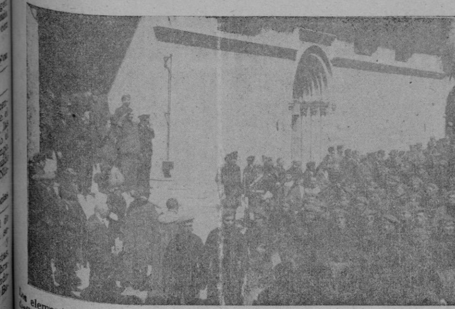
Elementos de Falange Española Tradicionalista y de las J. O. N. S., en magna manifestación, durante la mañana de ayer, ante las primeras Autoridades, en el Patio de la Almadaina