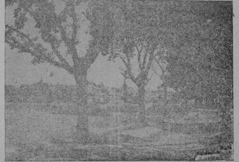
Guadalajara. — Vista general