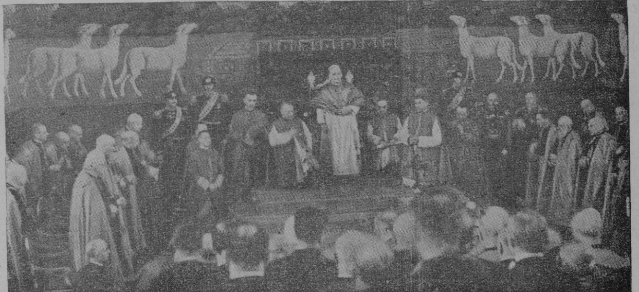
El Padre Santo disponiéndose a dar la bendición a los asistentes a la inauguración del Pontificio Ateneo Lateranense en 3 de noviembre 1937