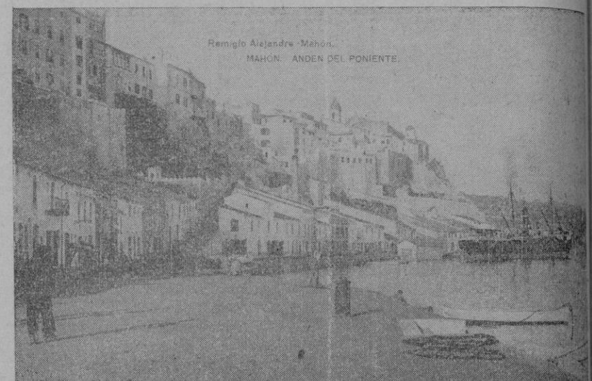
Vista del puerto de Mahón