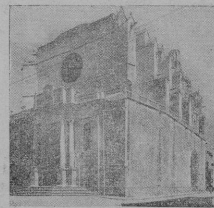
Ciudadela. — La Catedral

Las fuerzas nacionales, ya grandemente aumentadas con fuertes lumnas de refuerzo enviadas al efecto, se apoderaron de toda la isla entre los vitores y aclamaciones de la población.