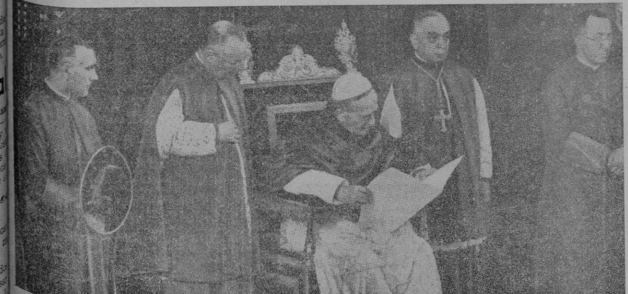
Su Santidad el Papa leyendo el programa polifónico ejecutado por los alumnos en la inauguración del Pontificio Ateneo Lateranense en 3 de noviembre 1937

En 25 de abril de 1918 el Pontífice Benedicto XV le designó para ir como Visitador apostólico a Polonia. Continúa al final de la primera columna de la segunda página)