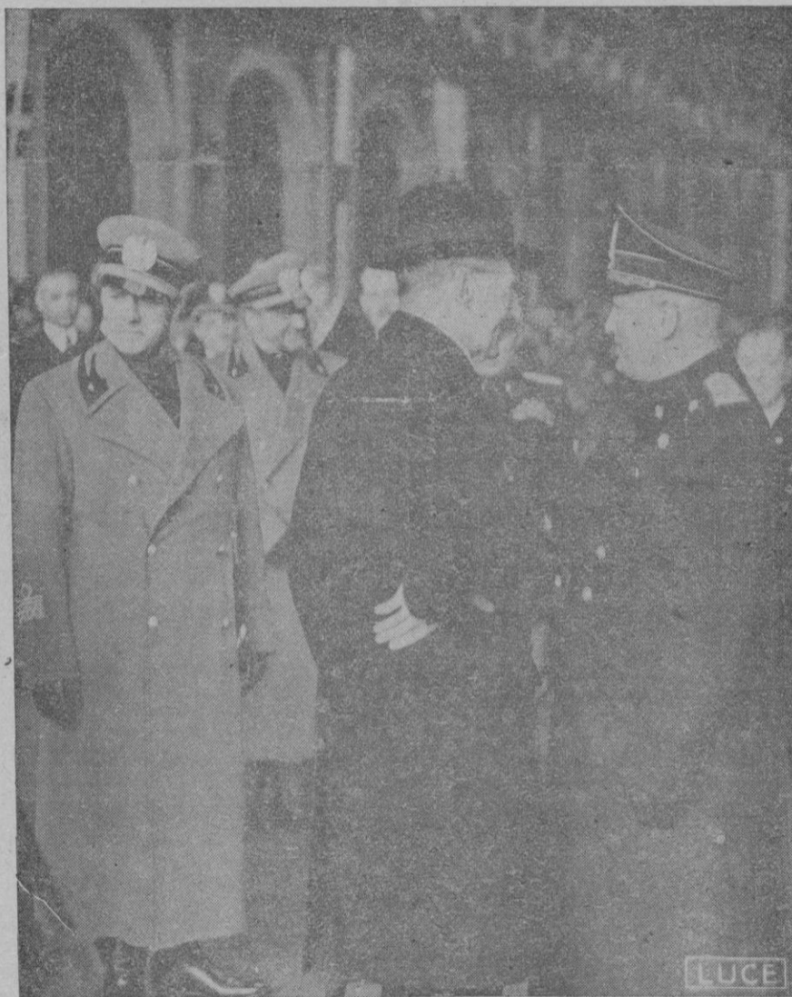
Roma. — Mr. Chamberlain se despide del Duce en la estación Termini, al abandonar Roma para regresar a Londres, apareciendo también en primer término el Ministro de Negocios Extranjeros de Italia, Conde Ciano

nes y amortizaciones acumulados aunque los títulos hayan sido declarados y los poseedores no hubieran recibido indicación expresa del mencionado Comité. Las personas comprendidas en los tres párrafos anteriores deberán solicitar de los Bancos extranjeros correspondientes los libramientos de los cheques antes del día 20 del corriente mes, día en que termina la amnistía concedida con el fin de evitar la aplicación de las sanciones establecidas en el presente anuncio se dicta para la mejor ejecución de las disposiciones urgentes y sin perjuicio de que una vez apurado el plazo de amnistía las divisas que se perciban por cualquier concepto serán cedidas al Comité en el término de ocho días.