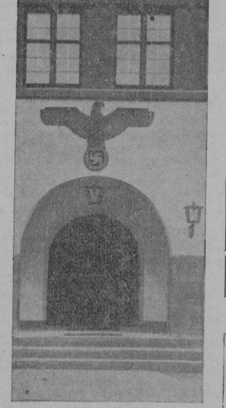
El portal de entrada a la casa de Hitler, en Berchtesgaden, junto al que el Führer recibió al ilustre estadista inglés, cuyo gesto en favor de la paz tantos elogios merece

"Le Soir" al atacar a Lord Chamberlain y a los que se le han asociado, sin excluir al mismo Daladier, dice que el pueblo no está con ellos.