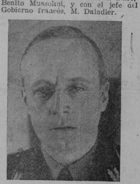
El Ministro de Negocios Extranjeros del Reich, Barón von Ribbentrop, que recibió a Lord Chamberlain en Munich y le acompañó hasta Berchtesgaden

El primer Ministro británico habló también por teléfono con el Duce, Benito Mussolini, y con el jefe del Gobierno francés, M. Daladier.