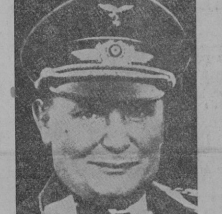
Chamberlain llega a Munich

Inmediatamente después del en que iba Chamberlain, despegaron dos aviones más, de respeto, que convoyarán al del primer Ministro.