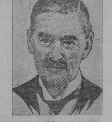
El "premier" Ministro de Inglaterra, Lord Chamberlain

Prestaba guardia una compañía de la guardia personal del Führer. Este, tan pronto como descendió Lord Chamberlain del automóvil, se