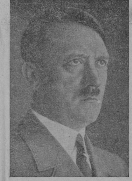
El Führer - Canciller de Alemania, Adolfo Hitler

Berchtesgaden. — A las cuatro de la tarde de ayer llegó a esta ciudad, en tren especial, procedente de Munich, el jefe del Gobierno inglés, Lord Chamberlain.