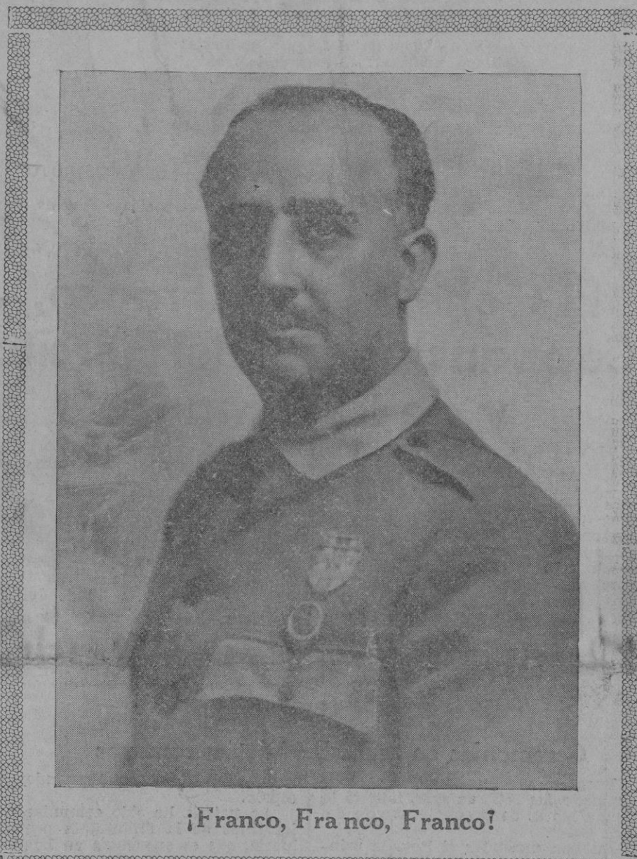
¡Franco, Franco, Franco!

nieron a unirse en las filas de nuestra Cruzada sacrificando sus hogares y se enrolaron en las filas nacionales para demostrar la simpatía de sus naciones por nuestra Causa y la firmeza de amistad que nos profesan, un motivo del amor que les guardamos.