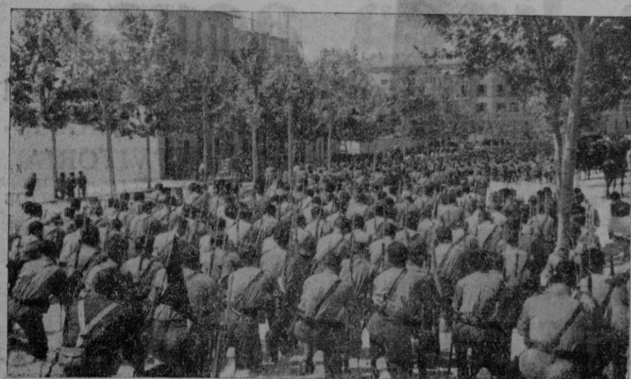
...Se postraron las bayonetas y las banderas

Vivió ayer nuestra ciudad —ataviada con sus ropajes de gran gala— el segundo de los días conmemorativos del glorioso Alzamiento nacional.