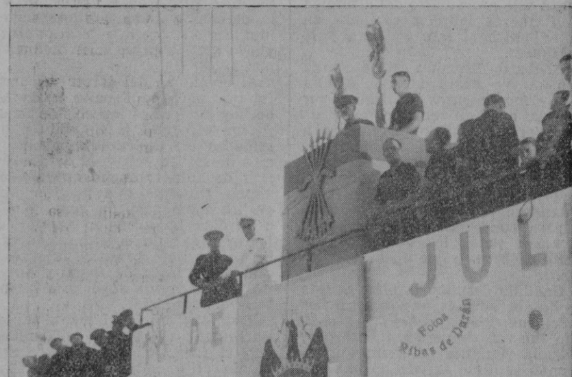
...Un veterano militar habló al gentío, con estilo tajante y recto, auténticamente castrense

Terminó pidiendo a todos dejase las minucias a un lado para sacarse por España, puesta la mira en su brillante tradición y en lo que hoy ordena el Caudillo, Generalísimo Franco, al que saludó con respeto, diciéndole alabanzas, y así dijo, te-