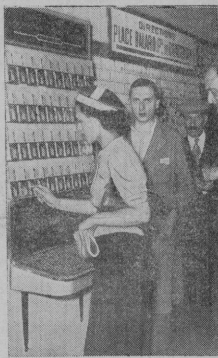
En el Metro de París han colocado autómatas, en los cuales los viajeros pueden sacar billetes. Estos están provistos con informes en cinco idiomas acerca del horario de los trenes, a qué hora están abiertos los museos y demás cosas de interés para los turistas

Durante el vuelo, los pilotos recogieron importantes datos para calcular la resistencia de los motores en las capas superiores, y han informado que en el exterior de los aparatos llegaron a registrar una temperatura de sesenta y seis grados bajo cero.—Mundial.