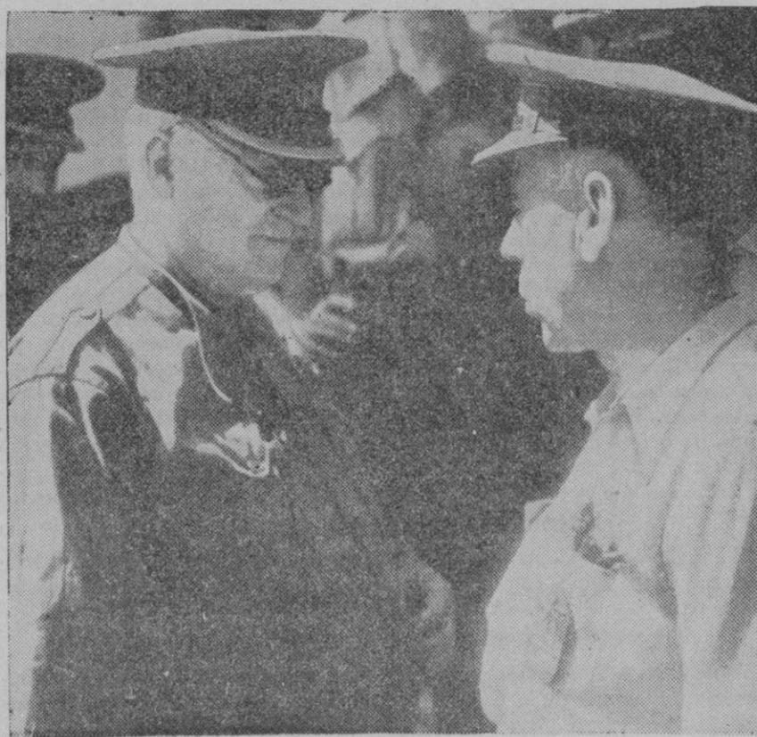
Miaja, en los últimos días de la defensa de Madrid, discutía con otro jefe rojo el modo de continuar la resistencia. Sus planes criminales fallaron. Franco hizo imposible más derramamientos de sangre. Hoy Miaja, el partidario de la lucha hasta la muerte... de los otros, está bien acomodado en Méjico, con los tesoros robados y rodeado de su familia intacta. Los "otros", los que debían resistir hasta morir, se pudren en los campos de concentración de Francia o andan errantes por el mundo en busca de la "fraternidad" en que creyeron y no encuentran