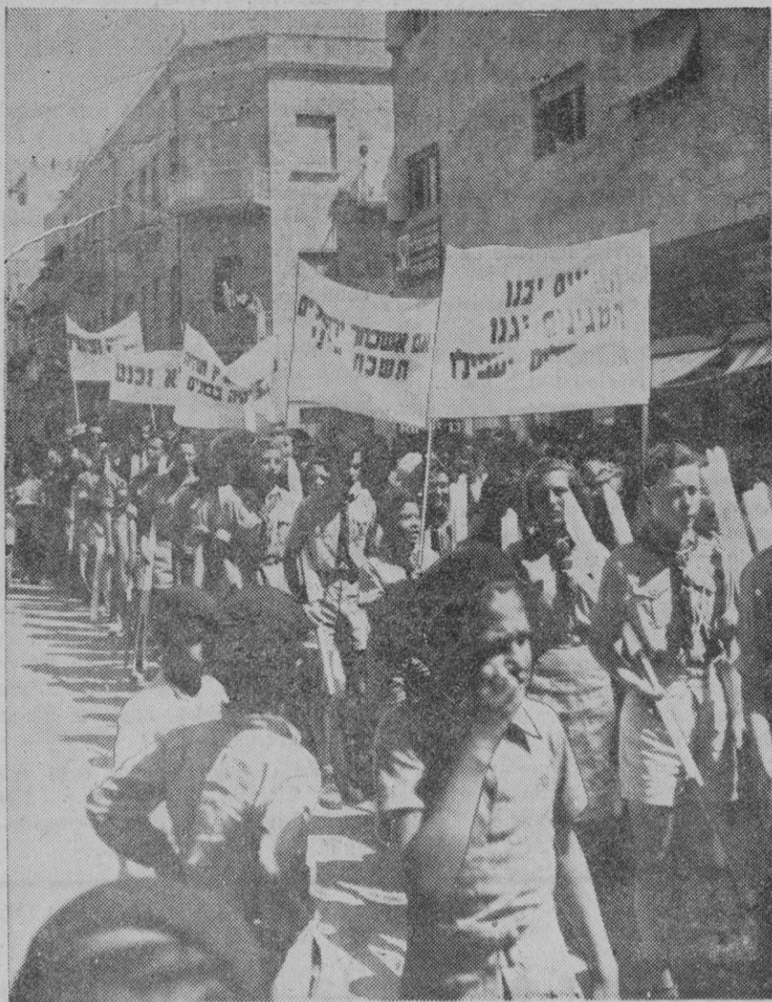
Primera fotografía de las manifestaciones públicas de los judíos contra la proposición británica que está dando lugar a sangrientos sucesos en Tierra Santa