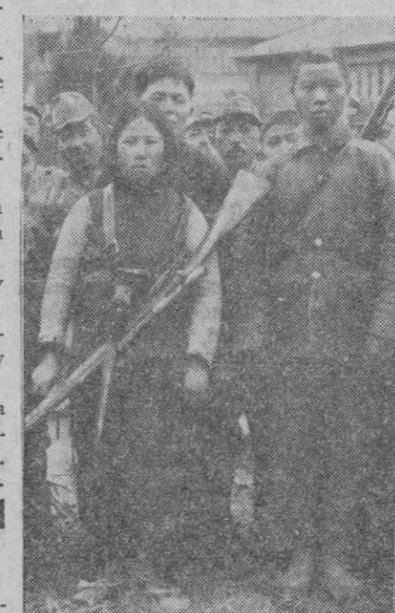
Soldados chinos hechos prisioneros por los japoneses, entre los que se ve una mujer china cogida con armamento en el frente de batalla

Visita del embajador inglés en Tokio al ministro Harita