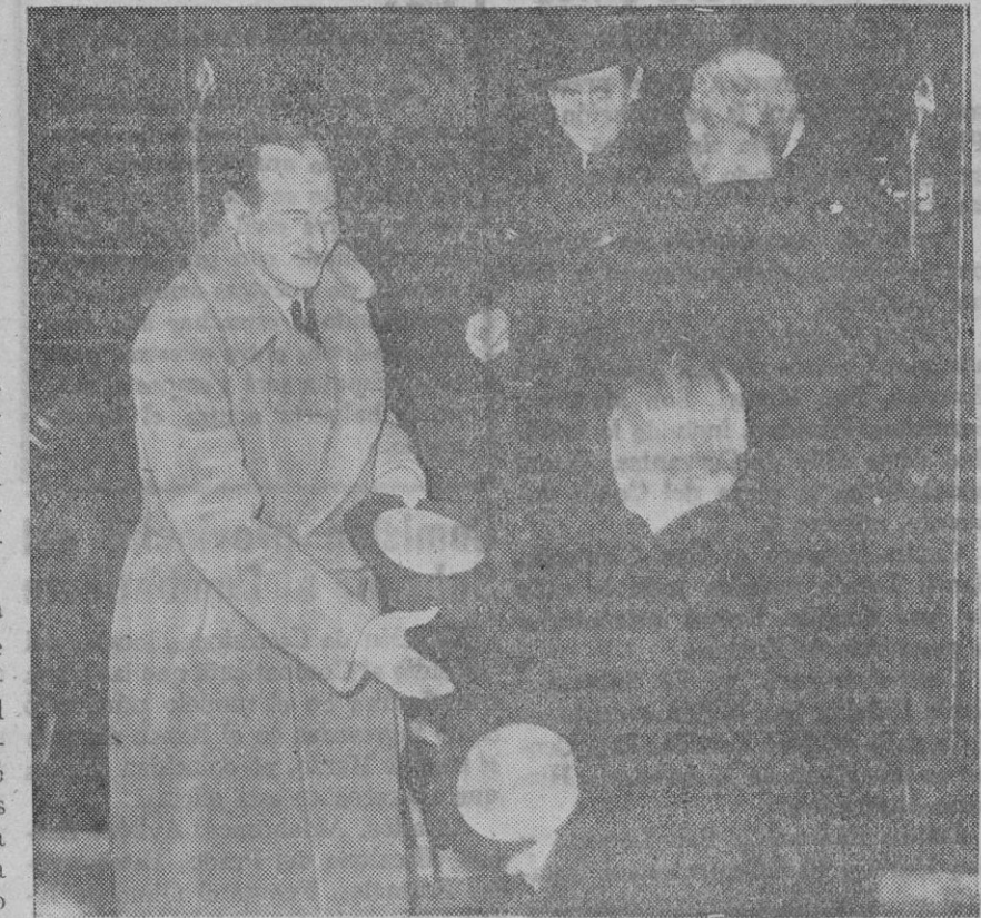
El coronel Beck, ministro de Negocios Extranjeros polaco, a su llegada a Londres, donde se entrevistó con lord Halifax.

París, 17.—Ayer llegaron a un puerto de Gibraltar los barcos franceses «La Fantasche» y «La Terrible» y los superdreadnoughts «Lorraine» y «Bretagne».