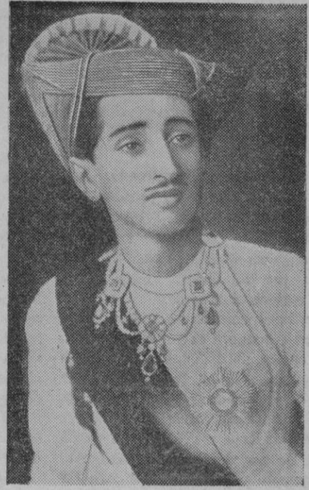
El Maharajah de Indore (India inglesa), el cual, con motivo de haber explotado una bomba durante una sesión del Consejo de su país, acusa del atentado a una dama europea con la que se casó secretamente y que conoció en uno de sus viajes de recreo por Europa

Inglaterra ha fracasado en el Sudeste con sus intentos de acorralar a Alemania. por el simple hecho de que en ellos se respeta al vecino. Y hoy sabe el Reich, que los pueblos y Gobiernos del Sudeste europeo están en el camino que les conduce a la convicción de que un cerco y debilitamiento de Alemania lo deben rechazar en bien de sus intereses vitales, porque con ello se asestaría un golpe mortal a su bienestar y a sus posibilidades de desarrollo.