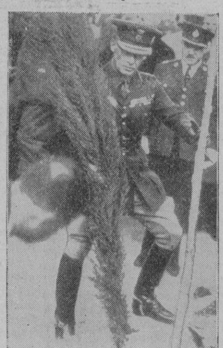
El Rey Jorge de Grecia, cuyo reino corre peligro de desaparecer, a causa de la ocupación de Albania por Italia. En la foto se ve al Monarca heleno tomando parte en la fiesta de la Semana del Arbol, celebrada en Atenas y en la que dicho Soberano planta un arbusto para dar ejemplo a sus súbditos

Una Agencia de Nueva York informa que la entrada del Generalísimo Franco en Madrid se verificará el 2 de Mayo, coincidiendo con el aniversario del levantamiento del pueblo madrileño contra la invasión de las tropas napoleónicas.