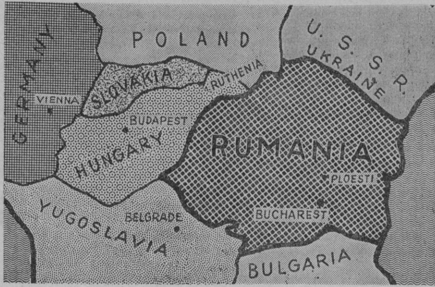
Gráfico en el que aparecen los límites de Rumania con otros Estados de Europa Central, cuya nación acaba de ligar sus intereses económicos a Alemania por medio de un Tratado modelo

El acuerdo germano-rumano es fundamentalmente un contrato básico, cuyo contenido práctico se hará realidad por el desarrollo progresivo del mismo, y puede dentro de su normal evolución sufrir todavía algunas modificaciones. El presidente del Consejo rumano, Calinescu, ha declarado con pleno acierto, que por parte de Alemania no existe ninguna pretensión de monopolio, y, de hecho, el contrato no tiene ningún carácter de monopolizador por lo que respecta a otros países; y ha añadido, que este Tratado asegura la independencia de Rumania y que, por otra parte, Alemania ni ha bloqueado determinadas cantidades de petróleo o de trigo ni Rumania está a merced de la importación alemana. El acuerdo es en todos sus aspectos elástico y lo que con él se persigue es una leal armonización de los intereses mutuos. Ha fortalecido indudablemente la posición económica de Alemania y con ello su situación política, pero al mismo tiempo proporciona grandes ventajas a Rumania; ventajas que desde un punto de vista material son quizá mayores que las que obtiene Alemania, ya que aquélla no sólo adquiere un comprador seguro a largo plazo de sus productos más importantes y cosechas, sino también un socio que pone por completo a su disposición sus experiencias económicas, técnica altamente desarrollada y arte de organización, para elevar su nivel de vida y, no en último lugar, los ingresos del Estado.