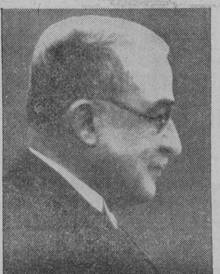
El general Metaxas, presidente del Consejo de ministros de Grecia, que ha hecho público que el Gobierno tiene garantizada la independencia e integridad de su país

El general Metaxas dice que la opinión griega debe permanecer tranquila