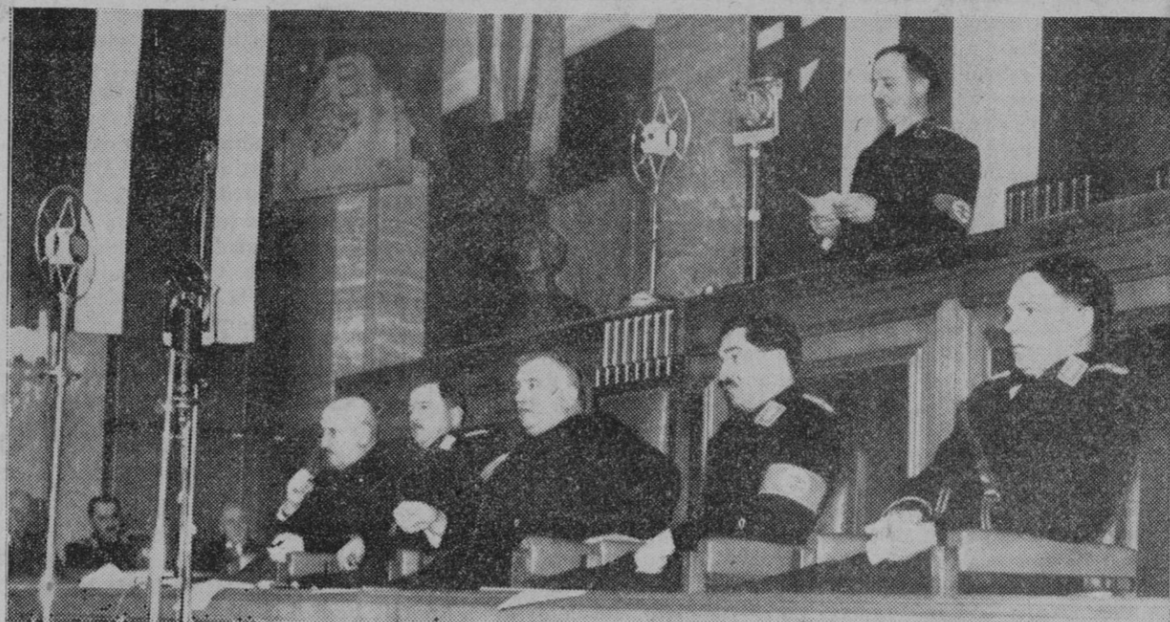
EL ESTADO ESLOVACO.—Sesión de la Dieta en la que se proclamó la independencia del territorio eslovaco. Delante de la tribuna aparecen monseñor Tisso (en el centro, sentado) con sus ministros, que visten el uniforme de la guardia Hlinka

El sábado, 25, cuestación para Auxilio Social en Segovia y el domingo, 26, en los pueblos. Contribuyendo a ella, haces Patria