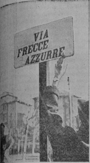
En todas las ciudades de Italia están cambiando los nombres judíos de sus calles. La ilustración muestra la calle «Freccie Azzurre», de Milán, en honor de los voluntarios italianos en España, denominada antes de Lazar Zamenhof

Esta noche lord Halifax dió un banquete en honor de los señores Lebrun, al que asistieron éstos, los Reyes, la Reina madre, miembros de la nobleza y del Gobierno. El banquete tuvo lugar en la sala donde se firmó el Pacto de Locarno.