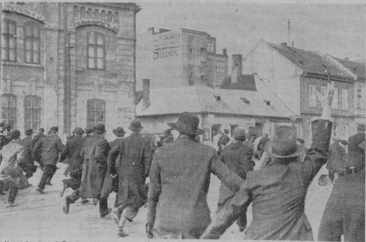
Al proclamarse el Estado independiente de Eslovaquia, los eslovacos se echaron a la calle, y en distintos puntos de Bratislava se lanzaron al asalto de los edificios militares donde los soldados checos quisieron hacerse fuertes. La foto recoge un aspecto de las revueltas

Por último, declaró ser incierto que el III Reich trate de estable- cer otro Protectorado en Eslo- vaquia.