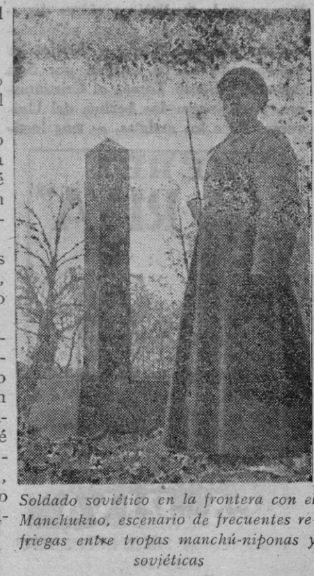
Soldado soviético en la frontera con el Manchukuo, escenario de frecuentes fricciones entre tropas manchú- niponas y soviéticas

Burgos, 3.—El «Boletín Oficial» publica una ley de la Jefatura del Estado por la cual queda en suspenso la inamovilidad, en cuanto a los cargos y puestos, de los funcionarios de la administración civil del Estado. Los distintos Ministerios dictarán las instrucciones necesarias para la aplicación de esta ley a los cuerpos y servicios que de ellos dependen.