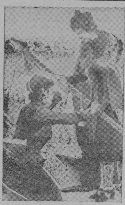
La princesa real Federica, de Grecia, entregando un nuevo estandarte a un miembro de la sección femenina de la organización nacional de la juventud de Atenas

También agradeció el Canciller al pueblo alemán el apoyo decidido que le viene prestando desde que se instauró la política nacionalsocialista.