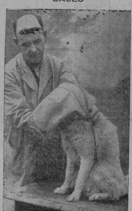
En Inglaterra se procura poner a salvo de los ataques aéreos incluso a los seres irracionales. Aquí tenemos a un buen inglés amostrando a un can para el uso de careta antigás