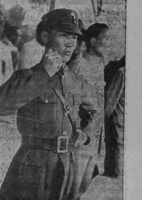
El general Cheng Cheng, que ha aclarado que los chinos lucharán hasta que los japoneses sean expulsados del territorio de China. El general Cheng Cheng es otro gran optimista

«El comunismo soviético combate la idea religiosa y la espiritualidad en todas sus formas. El comunismo disuelve la familia. El comunismo ruso aspira a establecerse en todas partes. Su fin es la revolución mundial. Es el