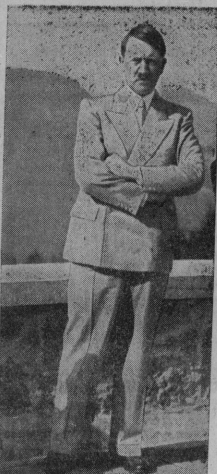
El Canciller Hitler, que hoy recibirá a Mr. Chamberlain en Obersalzberg

Más de 3.000 sudetes han atravesado la frontera checo-alemana