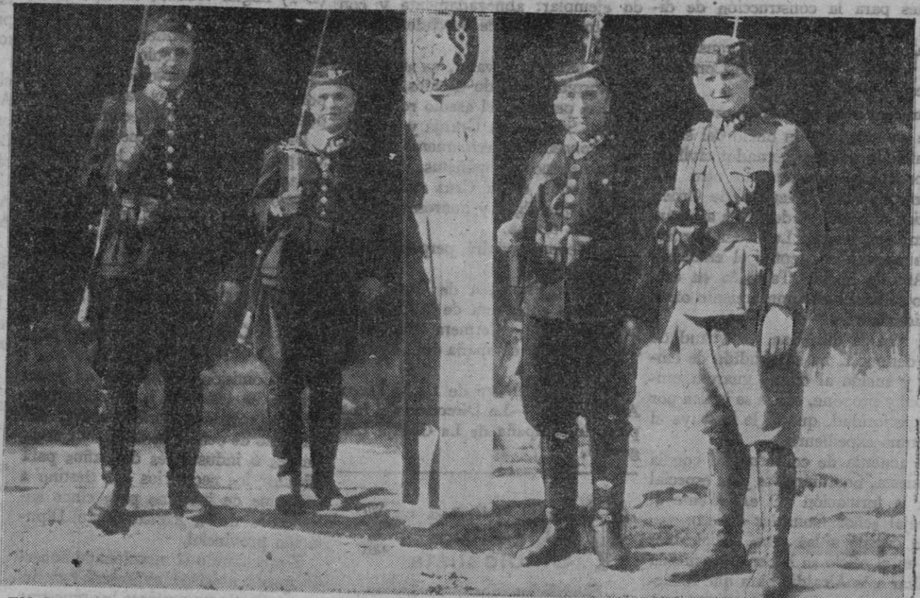
EN LA FRONTERA CHECA.—Gendarmes checos de vigilancia en la frontera con Alemania. En el centro, el poste que marca la divisoria de Alemania y Checoslovaquia

de Mr. Chamberlain a Alemania ha causado gran satisfacción en los Dominios.