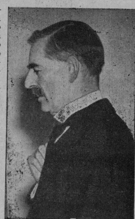
El primer ministro inglés, que esta tarde se entrevistará con Adolfo Hitler

Esta tarde ha llegado a Eger un evadido de la población sitiada por la gendarmería checa, el cual ha declarado que los alemanes sudetes de la misma se encuentran en apurada situación y cree que les espera la peor suerte.