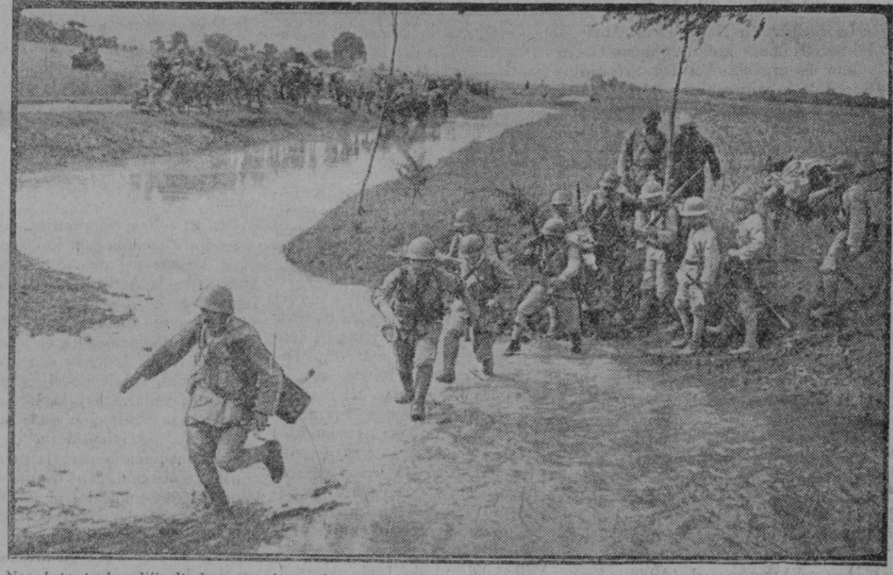
No obstante las dificultades que ofrece el terreno, los japoneses siguen avanzando en persecución de las tropas chinas que se retiran