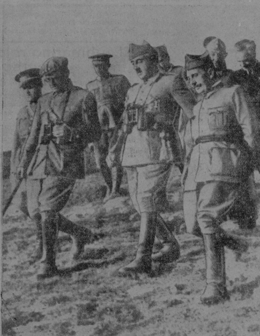
El Generalísimo, en los linderos del Mediterráneo, acompañado del general Dávila y de otros ilustres jefes, inspecciona el frente

En la tierra quedó un centenar de cadáveres bajo el sol de la primavera mediterránea. Esta es la última jornada de resistencia roja para frenar el ímpetu de las fuerzas de Aranda. Después, con el enemigo roto, ha seguido el avance hacia el mar. Antes se luchó con dureza y con ímpetu. Los rojos habían traído tres nuevas brigadas para sustituir a las destruidas en las dos últimas jornadas. Había empeño en mellar la flecha de los soldados gallegos hacia el mar y hacer su marcha difícil donde