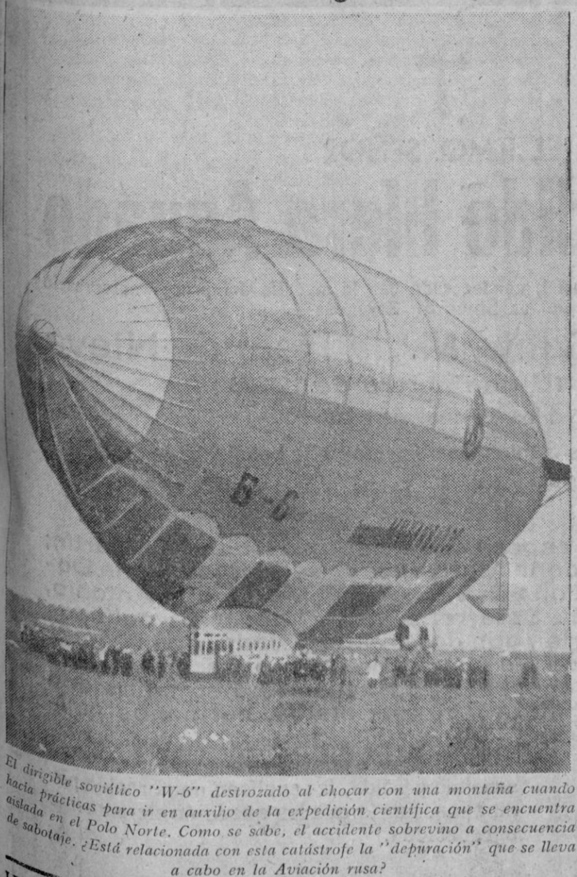
El dirigible soviético "W-6" destruido al chocar con una montaña cuando hacía prácticas para ir en auxilio de la expedición científica que se encuentra aislada en el Polo Norte. Como se sabe, el accidente sobrevino a consecuencia de sabotaje. ¿Está relacionada con esta catástrofe la "depuración" que se lleva a cabo en la Aviación rusa?

LECTOR: SI ERES COMBATIENTE POR ESPAÑA, NO TIRES ESTE PERIODICO, DALO A LEER A TUS COMPAÑEROS O LEESELO TU