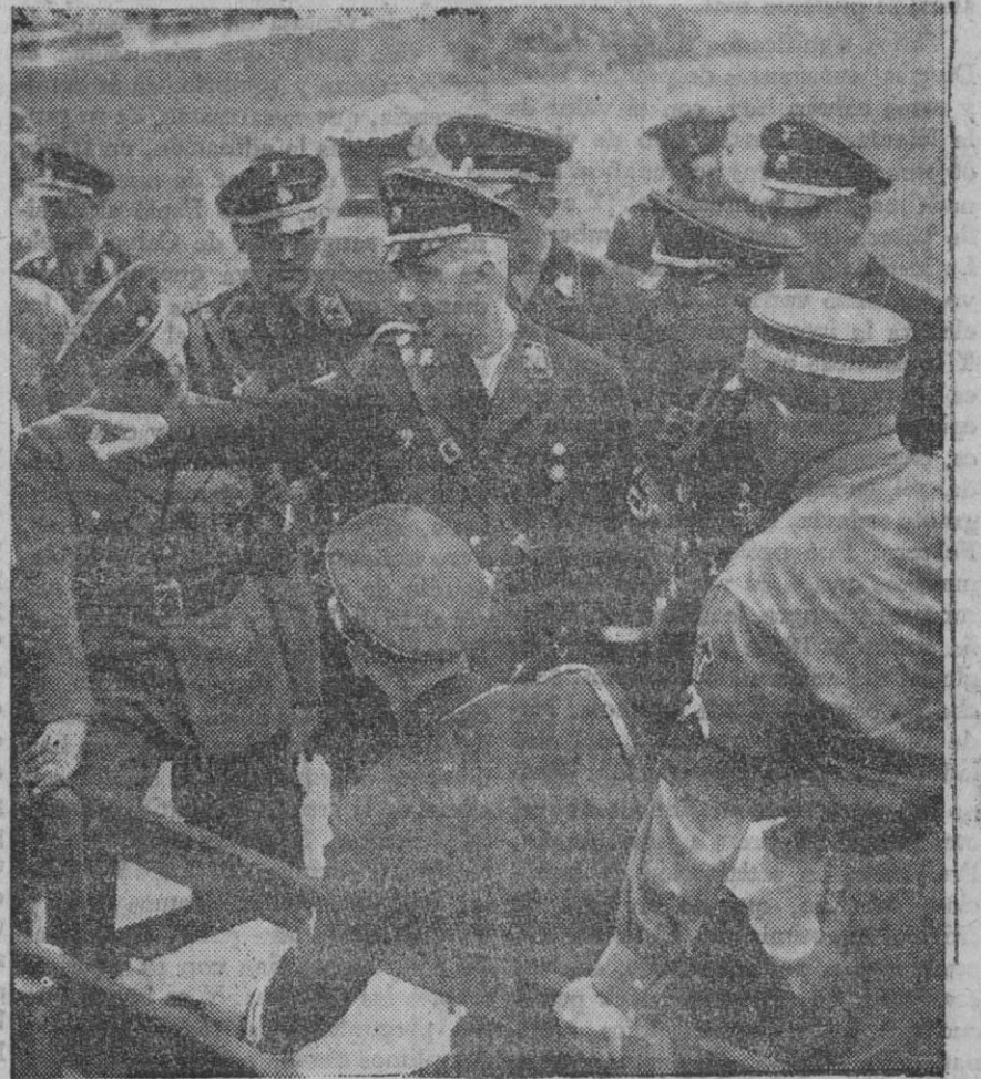
M. Himler, jefe de los «Camisas pardas» de Alemania, rodeado de algunos jefes de la organización, a quien la Prensa roja y democrática ha dado por muerto en los imaginarios choques registrados en Alemania

Bucarest, 16.—Todos los periódicos comentan la formación del nuevo Gobierno austriaco, y coinciden en opinar que ello constituye un triunfo de la política de Adolfo Hitler. La entrevista Hitler-Schuschnigg y sus resultados contribuirán a aclarar la política de Centro Europa.