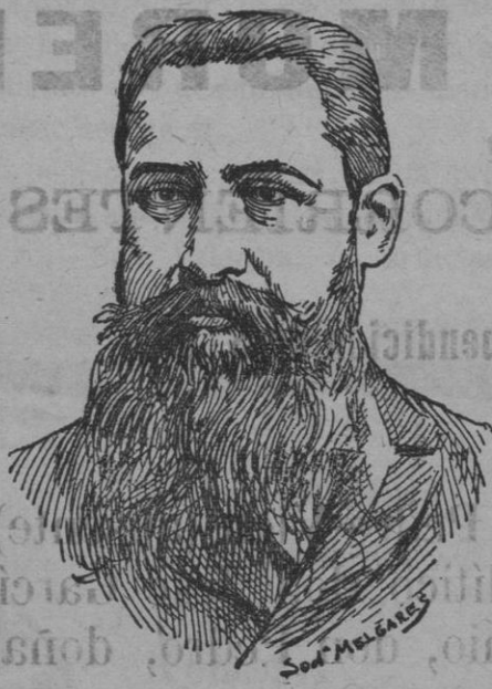
Nuevo Académico de la Lengua.