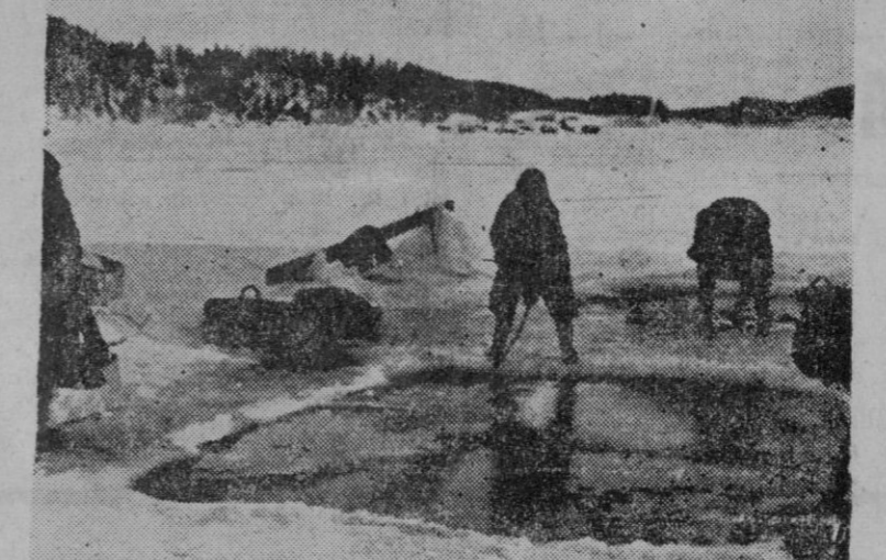
EL AGUA EN FINLANDIA.— El ejército finlandés, abnegado y sufrido como ninguno, es el ejemplo ante el mundo. Estos soldados de un sector del Lago Ladoga efectúan la labor — también penosa — de romper la dura capa de hielo para proveerse de agua.