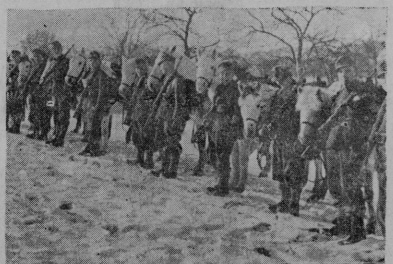
TROPAS ALPINAS ALEMANA S.— Una compañía de caballería alpina de las tropas de cazadores alemanes, preparados para unos ejercicios sobre la nieve.

Por contra, en Alemania, la situación es completamente distinta. Allí, el ejemplo de los años ha enseñado a todos que llevan infiltrado el Nacional Socialismo como el poder que ha puesto fin a la lucha aguda entre ambos que a los dos dificultaba. Cada alemán que lucha por mantener sus principios vitales y por defender su derecho de vida. Los objetivos de guerra de las Potencias Occidentales: fracccionar a Alemania, han causado impresión en todo s los alemanes que saben luchar por su espacio vital y por su unión.