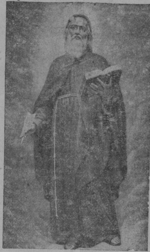
El Beato Ramón Lull, Polígrafo Franciscano Doctor Iluminado y gloria de Mallorca

món es uno de los hombres señeros de nuestra historia más populares y más admiradas. En tanto que la actualidad mallorquina, marcando ruta al camino de la intelectualidad universal que ha reconocido a Ramón Lull la grandeza majestuosa de los genios, ha dedicado esfuerzos inmensos y labor de horas y más horas, a desentrañar mediante los estudios lilianos, la profundidad formidable de los conceptos que en las obras del sabio florecen, como en la santa "mata" florecieron los nombres del Señor escritos milagrosamente. Y la Iglesia, por su parte, recordando los éxtasis del ermitaño, las lecciones del místico, los dolores del Mártir, le ha puesto en los altares, para que, postrados a sus plantas a los mallorquines, rueguen por su intercesión la protección divina para la Isla, cuyo nombre, cuyas inquietudes espirituales, cuya dedicación al estudio llevó él de fronteras afuera, enseñando en la Sorbona, predicando en los arenales africanos, preparando misioneros que llevaran — como él— a todas partes el nombre de Mallorca y la santa fe de Cristo. Día grande es el de hoy para nuestra ciudad y para la Isla entera. Y todos sin excepción debemos sumarnos a la fiesta franciscana, en que la Iglesia rinde el tributo del recuerdo sagrado al Beato Ramón a la vez ohra de los hijos del Serafín de Asis y orgullo justo de nuestra extirpe ilustre de españoles de las glorias magníficas de España.