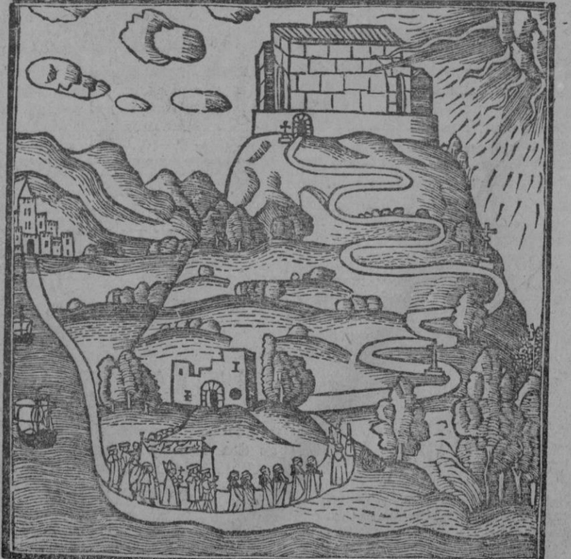
Monte de Randa, grabado antiguo del libro «Ars inventiva veritatis» existente en la biblioteca de la Sapiencia.