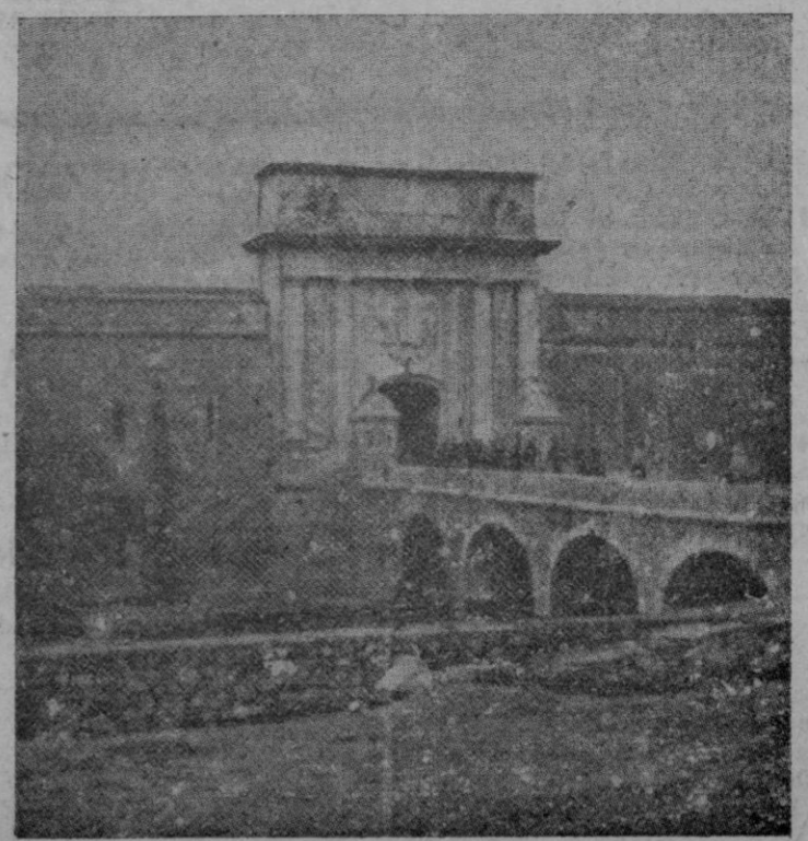
Negrín, Prieto, Caballero y compañía entrando en el Castillo de Figueras para celebrar la última reunión de las Cortes antes de su huida

El plazo para la admisión de instancias finalizará el 10 de Marzo.