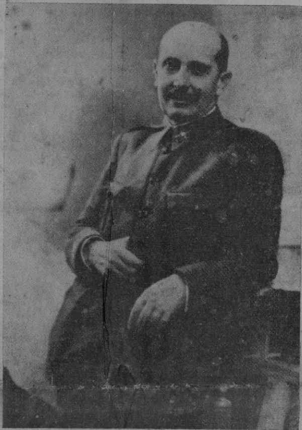
El Ministro de Defensa Nacional General D. Fidel Dávila