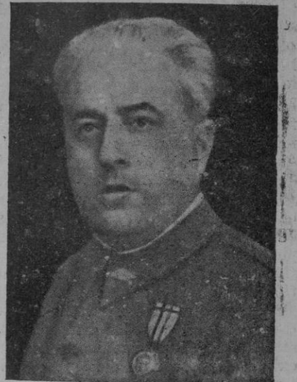
EL GENERAL YAGUE

Baste consignar para dar una idea de como abunda el material enemigo en Teruel que en una sola casa de