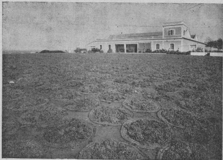
VIÑA "LA ATALAYA" Soleado de la uva

Venga el coñac Tres Ceros , que no engaña, y conquistó para el coñac de España. doquiera y siempre la más alta prez.