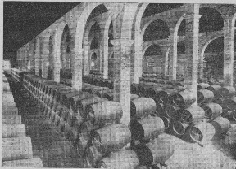
Bodega de SAN JOSÉ. «Bodega monumental», albergando en su recinto 25.000 botas de 500 litros cada una, de exquisitas y renombradas SOLERAS.

Y en su marcha triunfal lleva consigo, sabor de España y palpitar de amigo, porque es de España y porque amigo es.