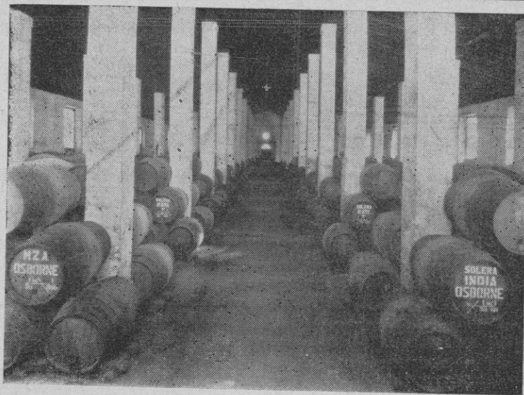
BODEGA DEL "COÑAC"

Su nombre vuela en alas de la fama, que por todo el planeta le proclama perfecto siempre y siempre sin rival.