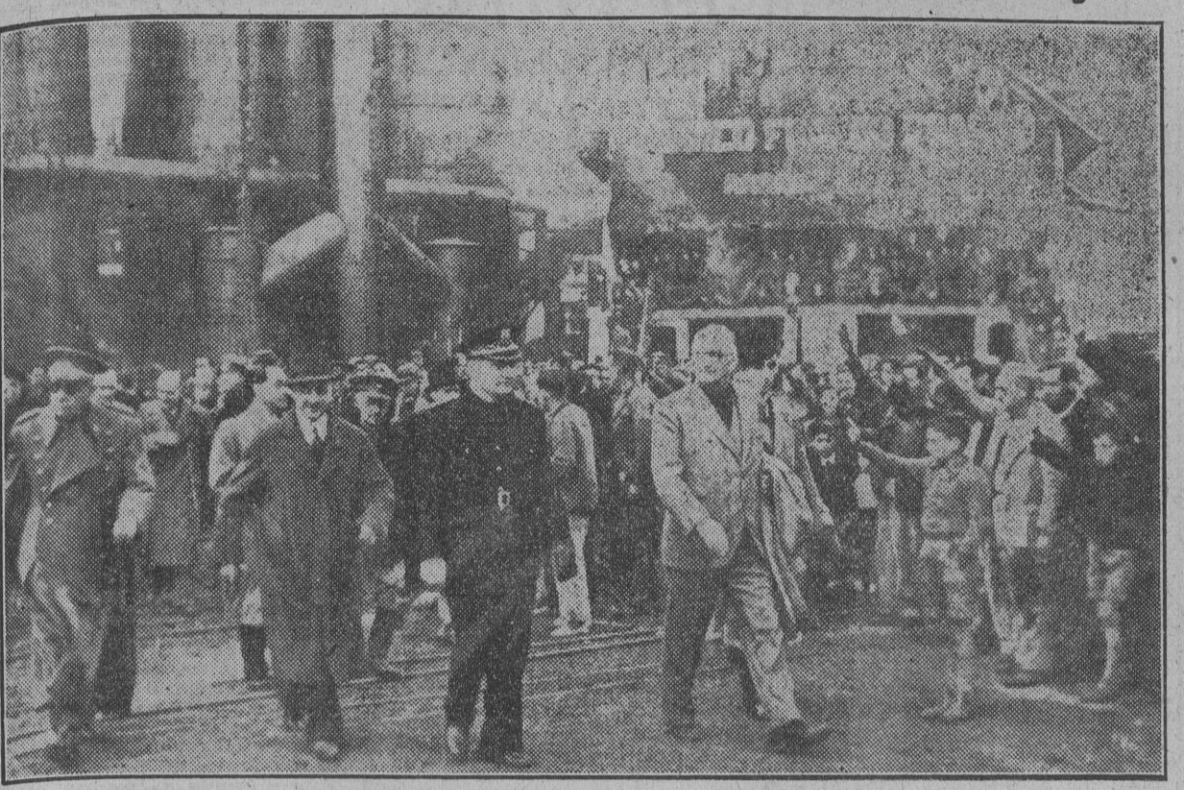
El ministro de Industria y Comercio, camarada Demetrio Carceller, inaugura en Sagunto uno de los dos altos hornos construidos en la Siderúrgica del Mediterráneo, con capacidad de fundición de 100.000 toneladas anuales.