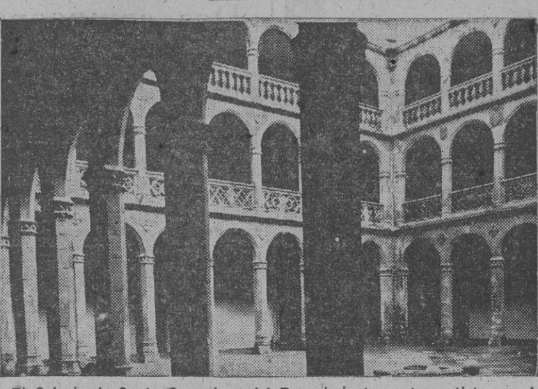
El Colegio de Santa Cruz, joya del Renacimiento cuatrocentista, en el que la Universidad vallisoletana tiene establecidos sus centros de investigación y sus laboratorios histórico-literarios.

Asistimos, sin duda alguna, a un nuevo resurgir de la cultura hispánica. Mejor dicho: estamos presenciando el momento de un anhelo de estudio y de ciencia que traerá a corto plazo el esplendor cultural que necesita España. Y es que, consecuentemente a toda guerra victoriosa, llega la exaltación de valores de la cultura, que articulan las directrices de una nueva vida. Porque a un gran empeño físico suele seguir otro gran empeño espiritual. Y cuando un país ha liquidado los gérmenes interiores de rebeldía, soldando su unidad política, es llegado el momento de evantar la civilización que se persigue. Recordad si no el apogeo literario de los siglos XVI y XVII. Aquel florecimiento y consecuencia de un espíritu militar, que a través del imperio, de la organización eficiente de un ejército poderoso. Y decayó la cultura cuando dejaron de ser la fuerza, el vigor y el esplendor de la cultura. Y decayó la cultura cuando dejaron de ser la fuerza, el vigor y el esplendor de la cultura.