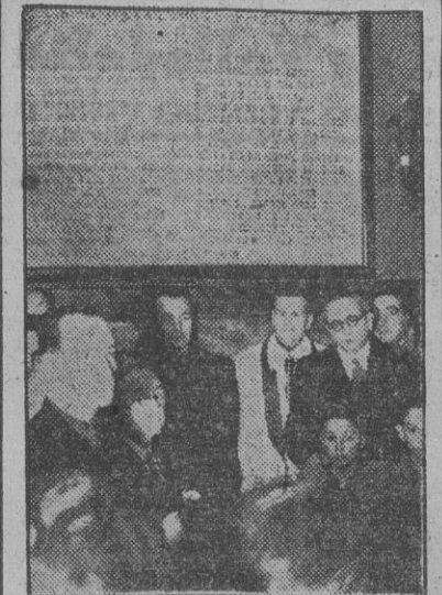
Con ocasión de haber sido inaugurados hoy los nuevos locales del Colegio Oficial de Farmacéuticos, se descubrió esta lápida, que perpetúa los nombres de los colegiados caídos por Dios y por España.

El Colegio Oficial de Farmacéuticos ha trasladado sus oficinas a la nueva casa situada en la calle de Fortuny, en el primer lugar del número de profesionales. Terminada la ceremonia religiosa se trasladaron todas las personalidades al nuevo local, instalado en la calle de Fortuny. En primer lugar, el párroco de la iglesia de San Sebastián procedió a la bendición del nuevo domicilio social. A continuación, se procedió al descubrimiento de una lápida, en la que constan los nombres de los 32 colegiados caídos por Dios y por España.