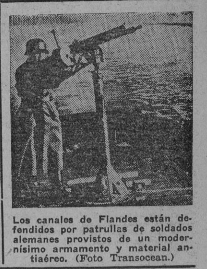
Los canales de Flandes están defendidos por patrullas de soldados alemanes provistos de un modernísimo armamento y material antiaéreo.