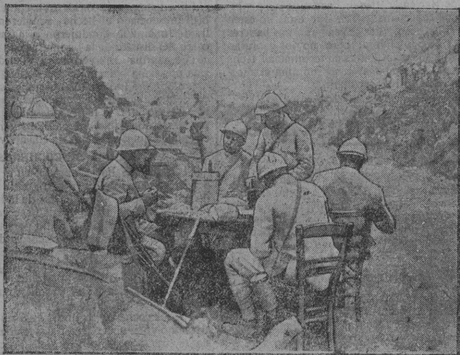
Delante de los abrigos de un regimiento de Infantería.—(Fot. Inf.)

Los norteamericanos siguen fortificándose en las posiciones tomadas en el arco de Saint Mihiel.