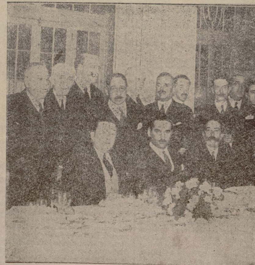
MADRID.—En el Palace Hotel se ha celebrado un banquete por el Comité de Madrid con motivo del proyecto de la autostada Madrid-Cuenca-Valencia, de una grandísima importancia para el tráfico vieno a cumplir en la red de carreteras de Esp.ña una necesidad imperiosa.