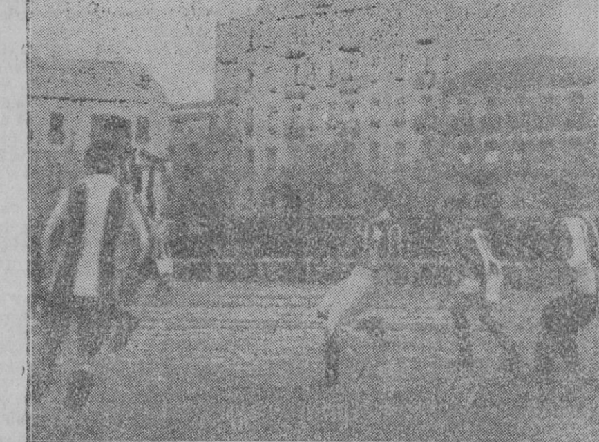
Interesante momento del partido «Gimnástico» «Nacional» jugado en la Corte.