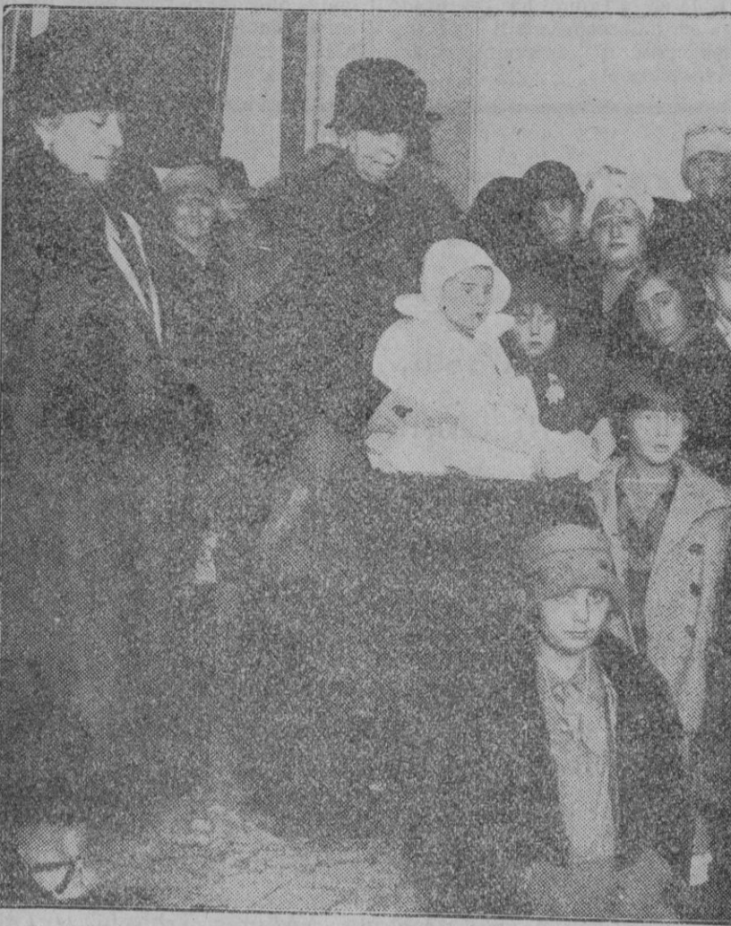
MADRID.—La Reina Doña María Cristina, repartiendo entre los protegidos de la Casa de Salud de Santa Cristina, ropas y dinero.

Ante esta perspectiva no podemos dejar de sentirnos optimistas, y al expresarlo hacemos votos para que los anunciados proyectos se lleven a cabo, y sea por consiguiente el año que comenzamos próspero para nuestra isla.