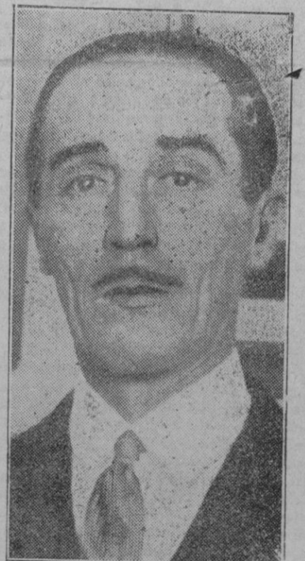
El Duque de Alba, que ha sido recibido solemnemente como presidente de la Academia de la Historia.

—Según eso... la vamos a empesá. Ya está usted cogía. —Ayá veremos. —¿Qué desé que si no es en Febrero, será en Marzo.