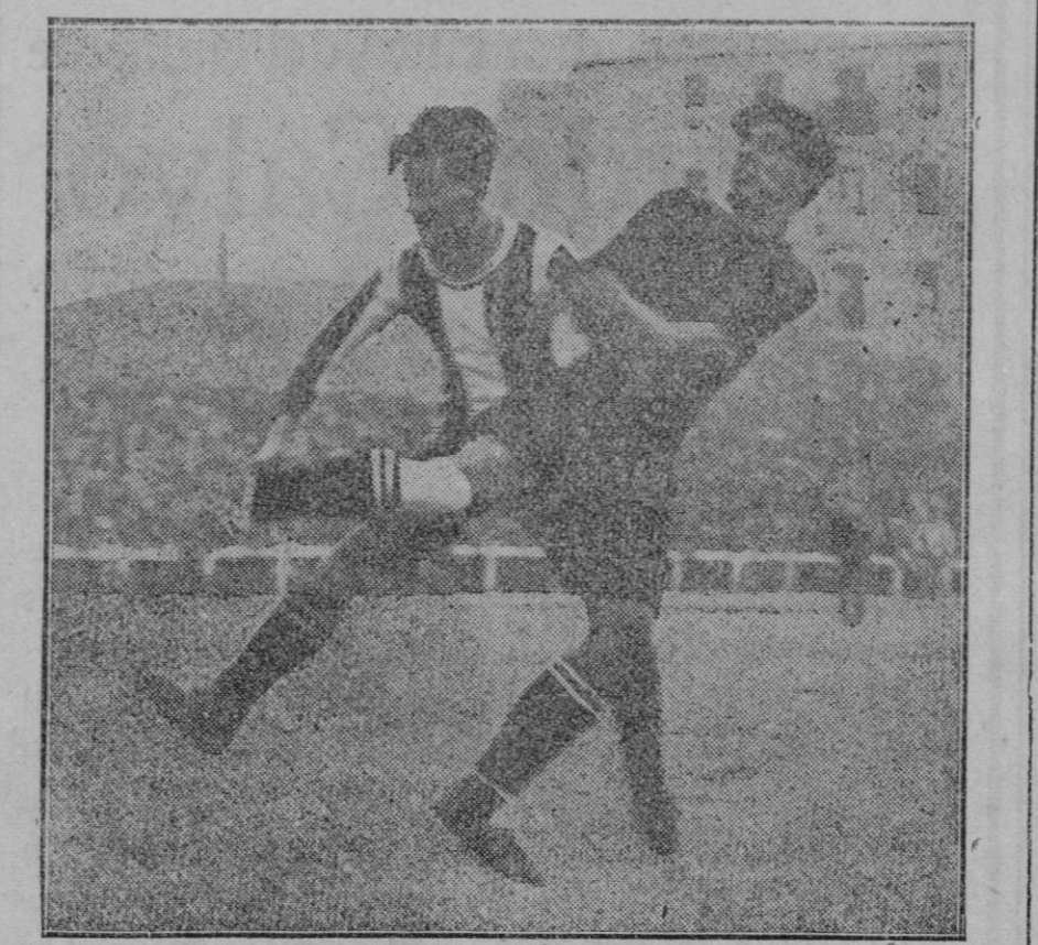
El partido «Racing» «Nacional».—Una defensa nacionalista interceptando un avance rancista.

Debido al interés que tienen los corredores en celebrar pruebas de tal carácter y el deseo de los aficionados de comprobar las condiciones de los corredores isleños, es de suponer que las citadas carreras de Reyes se verán animadas.