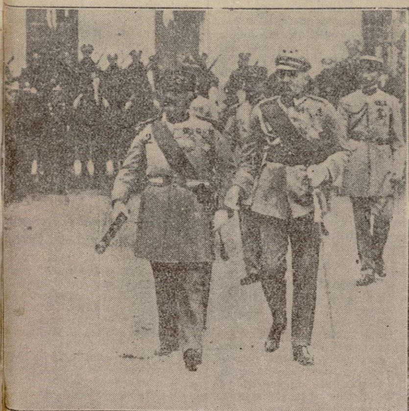
EN EL PATIO DEL PALACIO REAL DE VARSOVIA El Mariscal Pilsudski dictador de Polonia y General en jefe del ejército polaco en unión del Mariscal Francés Franchet D'Esperey momentos después de imponerle la medalla militar francesa.