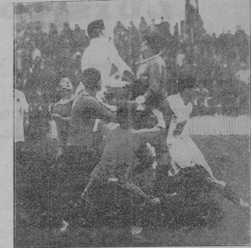
MADRID.—Un momento de apuro ante la meta usioista en el partido celebrado entre el «R. Madrid» y «El Unión».