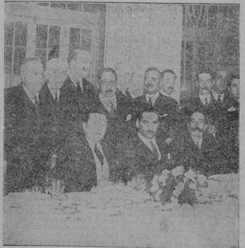
MADRID.—En el Palace Hotel se ha celebrado un banquete por el Comité de Madrid con motivo del proyecto de la autofasta Madrid-Cuenca-Valencia, de una grandísima importancia para el tráfico viene a cumplir en la red de carreteras de España una necesidad imperiosa.