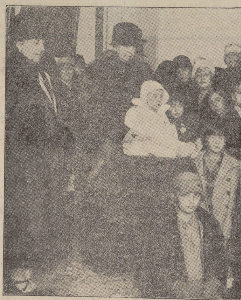
MADRID.—La Reina Doña María Cristina, repartiendo entre los protegidos de la Casa de Salud de Santa Cristina, ropas y dinero.

época de actividad, de intensificación de trabajo beneficiosa para todos. Ante esta perspectiva no podemos dejar de sentirnos optimistas, y al expresarlo hacemos votos para que los anunciados proyectos se lleven a cabo, y sea por consiguiente el año que comenzamos próspero para nuestra isla.