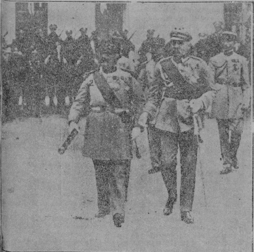
EN EL PATIO DEL PALACIO REAL DE VARSOVIA El Mariscal Pilsudski dictador de Polonia y General en jefe del ejército polaco en unión del Mariscal Francés Franchet D'Esperey momentos después de imponerle la medalla militar francesa.