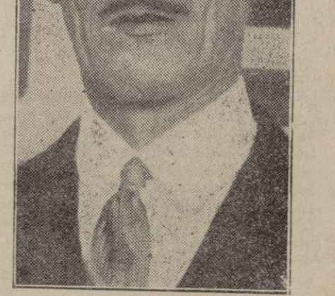
El Duque de Alba, que ha sido recibido solemnemente como presidente de la Academia de la Historia.

—¿Pensó usted en aqueyo? —No. —¿Por qué? —Porque eso no se piensa: o sale de adentro o no sale. —¿Me es igual? ¿Sale? —Miste: lo que tengo de responderle a usted lo sé desde er día que estruó usted la capa. —¿Le gustó? —Me gustaron los emboscos. —Estos son, Coloros. Juegan con sus labios de usted. —Con mis labios no juega nadie, amigo. —¿Pos a vé si me contestan formal: cuándo me saca usted der purgatorio? —Así pase er frío. Ya ve usted si lo apreso. —¿Es que dicen que año nuevo, vida nueva, y yo quiero principiá el año que viene en la gloria bendita. Es desé que de su raja de usted no me van a despegar ni con agua caliente. —¿Está usted aviao! En Enero no pelo yo la pava. —¿Por qué? —Por mór der relente. —¿Yo enpondré un puro, y usted se arrima a la candela. —Me vi a quemá. —¿Güano; pos lo dejaremos pa Febrero. ¿Le pasee a usted bien? —No señó, ¿En un mes loco vamos a empuar una cosa tan seira? —Según eso... la vamos a empuar. Ya está nató cogia. —¿Yá veremos. —¿Qué desé que si no es en Febrero, será en Marzo.