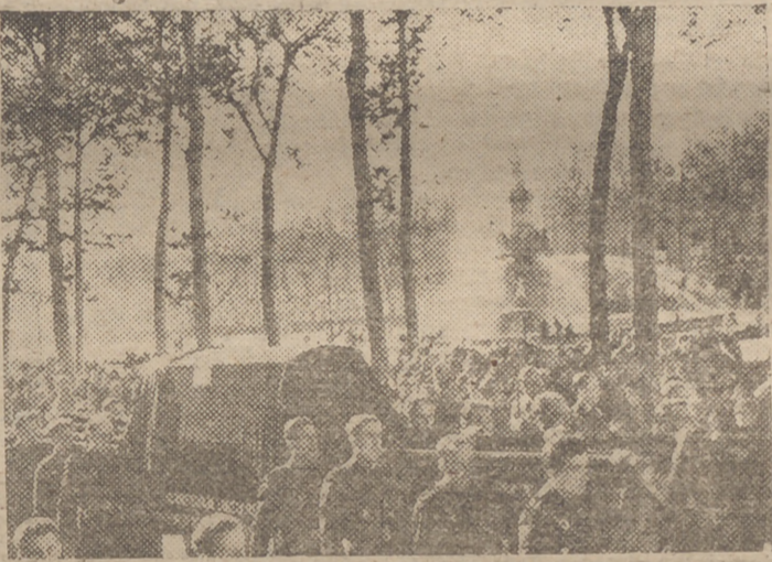
El cortejo fúnebre reanuda la marcha y sale de Aranjuez camino de Madrid.