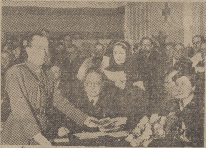
MADRID.—En la Cruz Roja Española se ha celebrado la entrega de diplomas a las nuevas enfermeras y recompensas de guerra, con asistencia de doña Carmen Polo de FRANCO, Presidenta de Honor de la Institución. —La esposa del Jefe del Estado, doña Carmen Polo de FRANCO, entregando varias condecoraciones ganadas en la guerra a uno de los jefes de camilleros de la Cruz Roja.

Los restos mortales de José Antonio cruzaron ayer las calles de Madrid, penúltimo día de esta dolorosa peregrinación a la que España asiste con lo mejor de su espíritu en el recuerdo del mártir. Aquel Madrid, en que José Antonio, inflamado de patriotismo, pensó y batalló para hacer en manos de la horda, recibió sus despojos con una feroz admiración y con el amor que para su patria tuvo el glorioso sacrificado. Hoy, el cadáver hallado en la batalla definitiva en El Escorial, será el epílogo que corresponde al emocionado homenaje del tránsito.