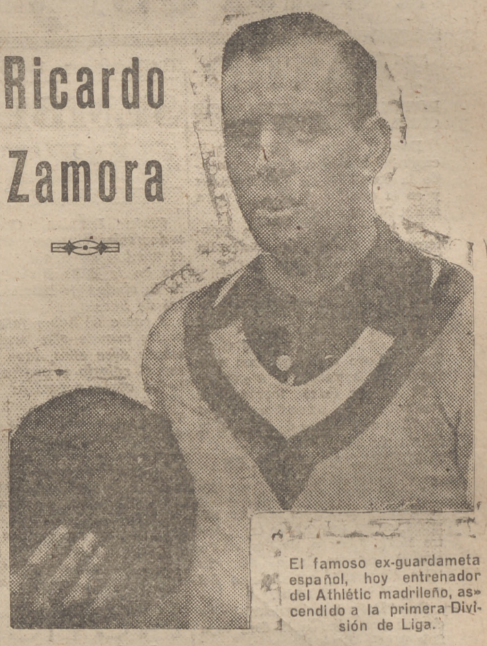
El famoso ex-guardameta español, hoy entrenador del Athletic madrileño, ascendido a la primera División de Liga.