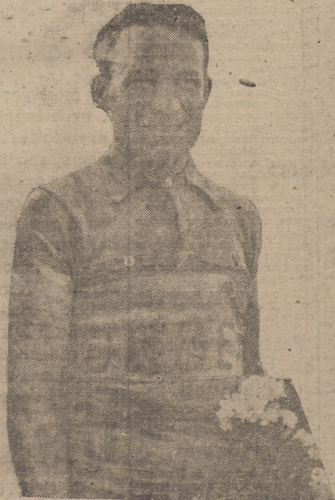
El excelente corredor catalán vuelve a ocupar el máximo puesto en el ciclismo español, esperándose reverdezca pasadas glorias en las competiciones nacionales anunciadas.