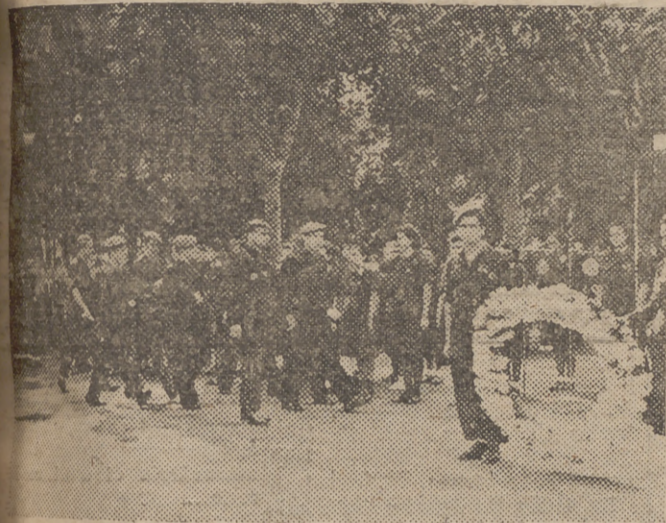
Los mandos de la Falange de Málaga y Melilla que presidieron ayer el acto de ofrendar una corona de flores al simbólico monumento erigido en el Parque.